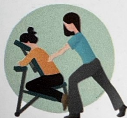
Massage amma assis